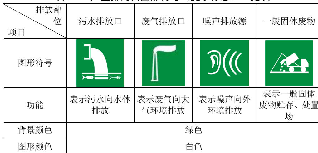
表 5-1 厂区排污口图形符号（提示标志）一览表